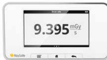
单视图 被选择参数的放大视图。