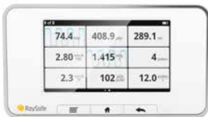
主屏幕 同时测量 1-12 个参数并加载波形。

RaySafe X2 触摸屏界面允许用户用全面且灵活的方式查看数据。主屏幕会显示附加传感器提供的每个可测量的参数。要放大任何参数，只需点击它就可以查看大图。快速滑动屏幕可显示波形。使用Menu、Home、Back 键使导航变得简单。所有的曝光都保存在主机中。在每一个会话场景中，你可以滑动屏幕迅速回到之前的曝光进行参考或比较。完整的测量会话场景可以上传到后期的 X2 View软件进行更多操作。