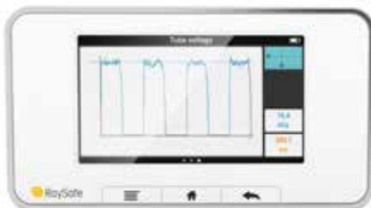
波形 千伏峰值、剂量率或电流值的概述和简单分析。