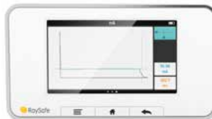
波形 智能算法容易识别和显示正确的电流值。